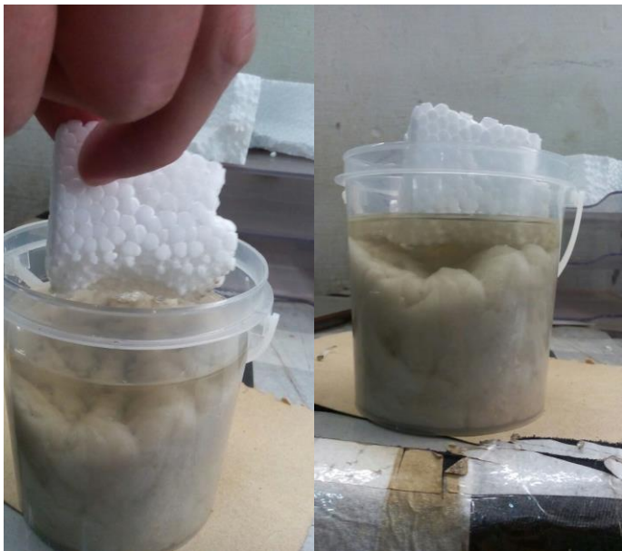
Figura 4. Processo de obtenção do poliestireno.

A Figura 4 ilustra o processo de obtenção do poliestireno através da dissolução do isopor em Thinner. Neste processo obtém-se uma cola que é utilizada para fixar os grânulos de EVA, dando formato a placa.