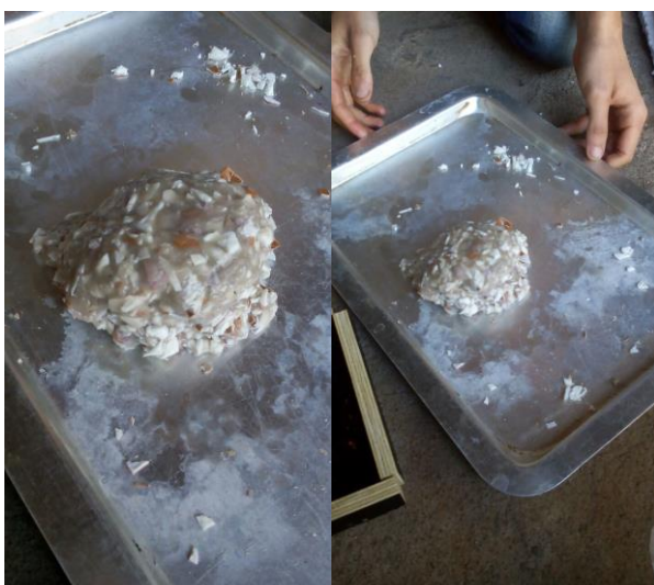
Figura 5. Processo de Mistura da cola com os grânulos de EVA.

A Figura 5 ilustra o processo de mistura da cola a base de poliestireno com os grânulos de EVA, dando origem a um material a ser moldado.