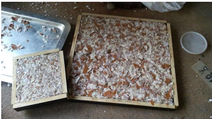
Figura 6. Processo de moldagem das placas.

Após esse processo de moldagem as placas descansam por algumas horas, até ocorrer a secagem da cola a base de poliestireno, dando origem assim a placa de uma divisória sem acabamento.