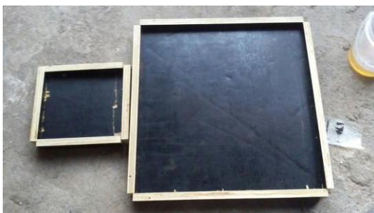
Figura 3. Formas utilizadas para moldar as placas.