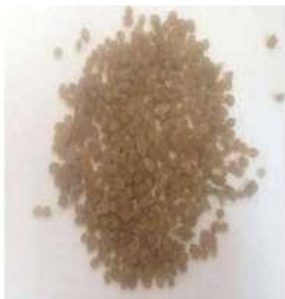
Figura 2. Grânulos de EVA utilizados.

Conforme ilustrado na Figura 2, inicialmente tem-se o EVA que foi selecionado, limpo e moído, obtendo-se os grânulos.