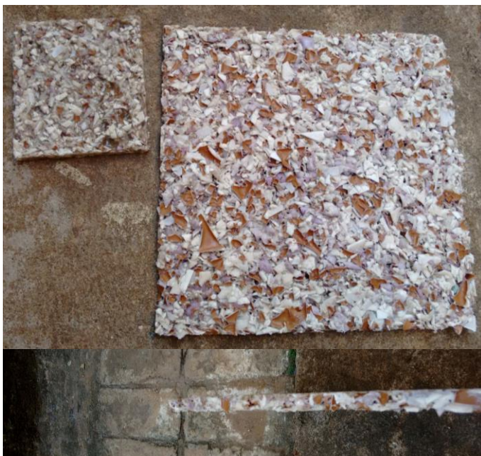
Figura 7. Placas obtidas com o eco-compósito.

Os aspectos sociais e econômicos devem ser evidenciados por também serem grandes favorecidos desta política verde, através de geração de empregos, tanto na parte de coleta seletiva quanto na abertura de novas fábricas, gerando assim, capacitação e oportunidades de emprego as pessoas, além disso, com a remuneração salarial a economia passa a contar com uma população economicamente ativa, gerando desenvolvimento ao país.