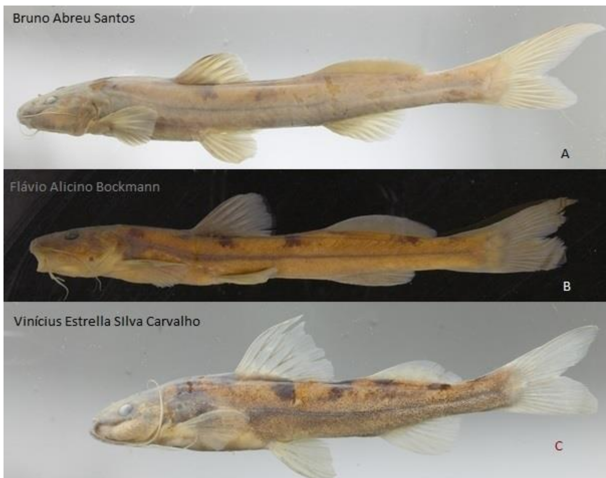
Figura 1. Vista lateral de exemplares de (A) Rhamdioglanis frenatus LAPEC 757, 150,4 mm CP; (B) Rhamdioglanis transfasciatus MCP 12188, 126,3 mm CP e (C) Imparfinis piperatus LAPEC 1042, 66,7 mm CP.

O único trabalho que abordou tangencialmente tais assuntos foi a tese de doutorado de Bockmann (1998), não publicada, na qual ele estabelece Rhamdioglanis como gênero válido.